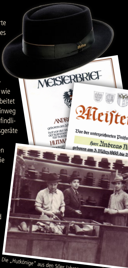
Die „Hutkönige“ aus den 50er Jahren

Tradition verpflichtet - und heute noch begrüßen Sie drei Generationen.