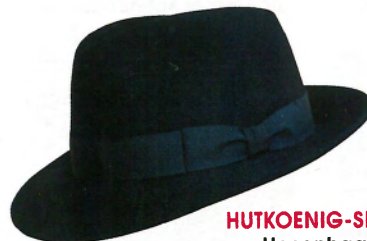
HUTKOENIG-SHOP.DE Hasenhaarfilz mit Seidenband, ca. 98 €

„ Die niedrige Hutkrone ist an der oberen Kante ringsherum eingedrückt. Sieht aus wie engl. SCHWEINEPASTETE , daher der Name. Mitte des 19. Jhdts. zunächst als Damenhut in Mode. Er fällt sehr flach aus und wird wahlweise aus Stroh gefertigt. “