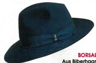
BORSALINO Aus Biberhaar, mit Seidenband, ca. 498 €

„Gehört zur Gruppe der Fedora-Hüte (s.r.). Erkennbar an der formbaren Krempe, relativ breitem Ripsband und dem Längsknick entlang der Hutkrone. Wurde durch HUMPHREY BOGART SO BERÜHMT , dass es heute seinen Namen trägt. “