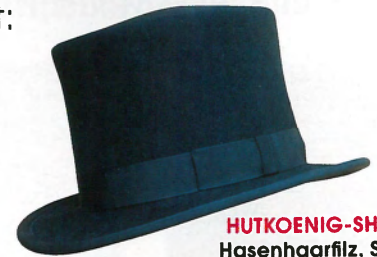
HUTKOENIG-SHOP.DE Hasenhaarfilz, Stepprand-Krempe, ca. 268 €

„ Aus Haarfilz, erkennbar an komplett abgerundeter, niedriger Hutkrone und schmaler, geschwungener Krempe. BENANNT NACH HUTMACHER THOMAS BOWLER , der ihn im 19. Jhd. meist für pensionierte engl. Offiziere anfertigte. “