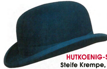
HUTKOENIG-SHOP.DE Steife Krempe, schmales Ripsband, ca. 258 €