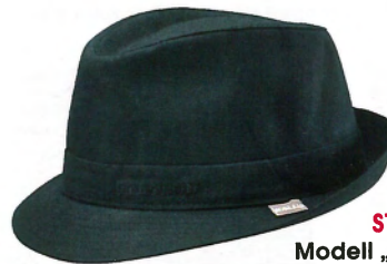
STETSON Modell „Teton“, Baumwolle, ca. 49 €

„ Hohe Krone, oben flach. Gleichmäßig breite Krempe, kann flach (Foto) oder geschwungen sein. Um Haarfilz-Zylindern Festigkeit zu verleihen, werden sie MIT SCHELLACK GESTEIFT . Einst Erkennungsmerkmal freier Bürger, Teil der Tracht. “