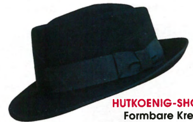
HUTKOENIG-SHOP.DE Formbare Krempe, aus Haarfilz, ca. 98 €

„ Der extrem kleine Hut mit der schmalen Krempe, die hinten hochgeklappt wird, erhielt seinen Namen nach der Londoner Bühnenversion von GEORGE DU MAURIERS ROMAN „TRILBY“ . Die Hauptdarstellerin hatte diese Hutform auf der Bühne getragen. “